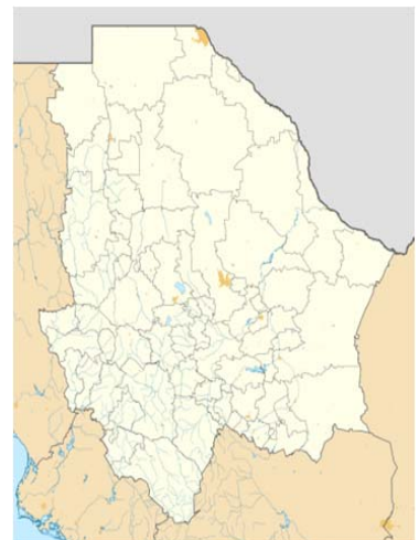
Ubicación de Praxedis G. Guerrero

Hidrológicamente hablando, pertenece a la Vertiente del Golfo. Su única corriente fluvial es el Río Bravo del Norte que sirve de línea divisoria con los Estados Unidos de Norteamérica y cortos arroyos tributarios que solo arrastran agua en los días de lluvia.