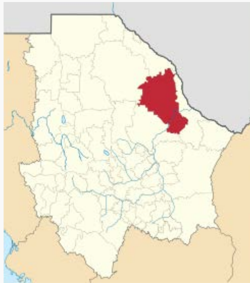
Ubicación del municipio en el estado de Chihuahua